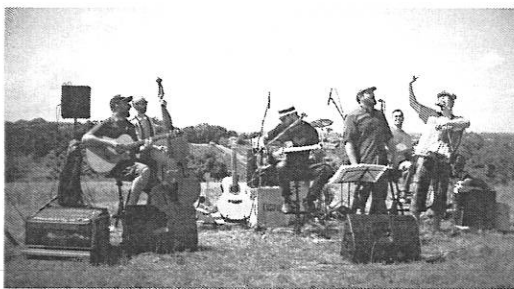
LUNA E UN QUARTO

Cuatri dis di concerti, incuintris e proiezioni che a pandin identitâts, sensibilitâts, ideis diferentis